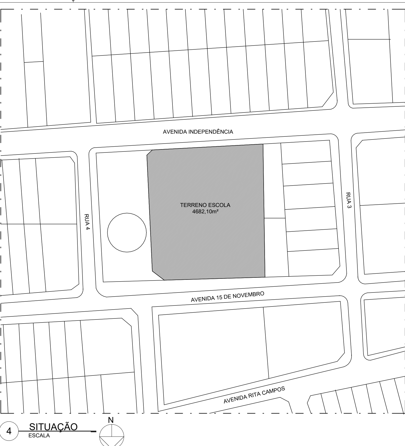
4 SITUAÇÃO ESCALA